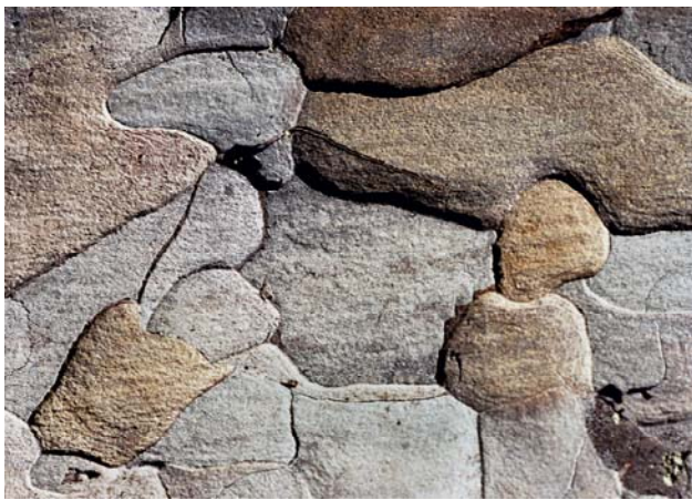
Na pograniczu natury i abstrakcji Prof. Andrzej K. Tarkowski